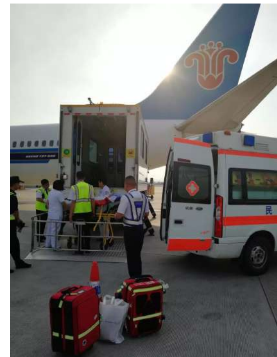
广州至乌鲁木齐患者 - 广州登机

通过广东民航医疗快线团队为患者提供的病床到病床(BTB)航空医疗转运服务,2018年8月25日23时15分,承载着希望的南航广州-乌鲁木齐CZ3138航班提前15分钟降落,早已等候在乌鲁木齐机场的急救中心医疗团队将患者送上救护车并送往医院,通过商业航班担架的转运方式,“966120”医疗团队顺利将身患重病处于昏迷状态的患者从广州转运回新疆乌鲁木齐医院继续治疗。做完病情交接,安顿好患者后已是凌晨2点。劳累了一整天,本该好好休息的医疗团队并没有好好冲个凉,美美地睡一觉;而是一丝不苟地检查、准备设备。因为内蒙古满洲里人民医院还有一位骑马受伤的游客需要紧急转回广州治疗,医疗团队要在4小时后搭乘最早一班飞机从乌鲁木齐赶往满洲里执行任务。医疗团队顾不上全身的疲惫,只希望4小时后的航班能准点起飞,能够及时赶到满洲里接受受伤患者回广州治疗。4小时后,06:30,医疗团队乘坐的海南航空乌鲁木齐-呼和浩特HU7887航班提前15分钟起飞,并于11:00到达呼和浩特塔子沟机场,医疗团队携带医疗设备立即换乘厦门航空呼和浩特-海拉尔MF8145航班,13:30分顺利到达海拉尔东山机场,早已等候在