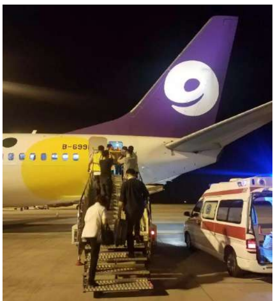
海拉尔至广州患者 - 海拉尔登机

旅客抬上飞机,经过4个半小时的飞行,安全到达白云机场,当医疗团队将患者顺利送达医院,交接完病