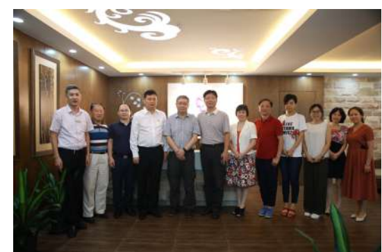
与《健康报》及省卫计委相关领导一行合影留念