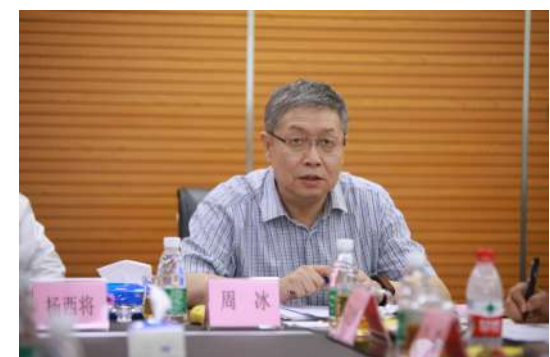
《健康报》周总编作出总结并给予了专业的意见和指导