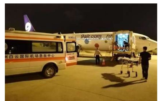
到达广州白云国际机场

担架医疗转运任务的顺利执行,离不开两地医院医护的密切配合,提供详细的病情报告,在出发前把患者的病情调整到最佳状态;离不开航空公司各部门的协作,提供无微不至的担架旅客服务;离不开机场急救中心的专业医疗处置和现场协调;离不开机场安检、地服等部门的支持;离不开好的天气和飞行条件;离不开转运团队的严谨周密安排;离不开患者和家属的支持与信任……航空医疗转运的顺利实施需要天时地利人和。