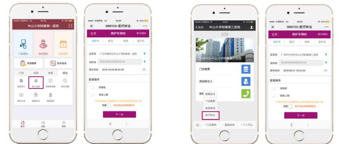
中山大学附属第一医院 APP 界面

为了您的健康，我们架起了一道爱的桥梁。在每一个日夜里，不管风吹雨打，不管严寒酷暑，我们肩负着病患家属的祈盼和重托。辗转于医院间、高速上、乡道里，永不停歇，当大家合家团圆，共享天伦时，我们仍日夜兼程地运转着，力求最快、最安全地将患者送到目的地。这就是我们的承诺，这就是我们的使命。